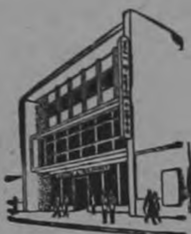
Fundado en 1925

Hay un modelo para Usted! Verdadera ganga en precio y condiciones